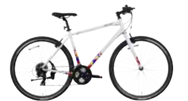
シンボルホワイト