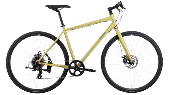
マットサンドベージュ