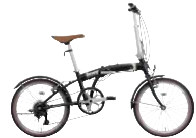
マットクロブラック