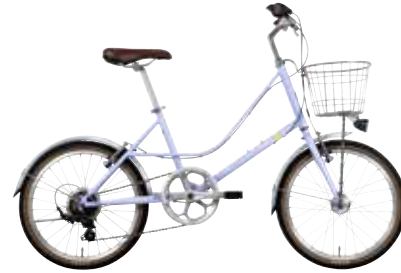
マットライトパープル