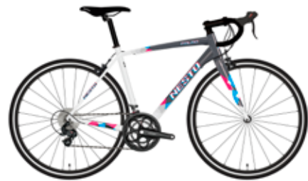
スモークグレー/アッシュホワイト