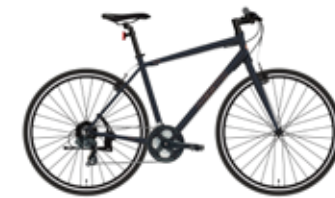
マットガンメタル