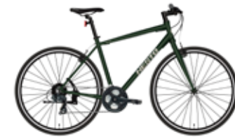
マットダークグリーン