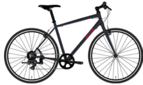
マットガンメタル