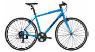
マットベイサイドブルー