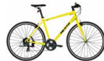
ソニックイエロー