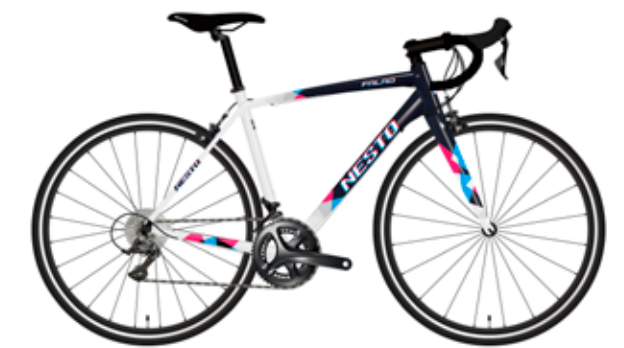
ミッドナイトブルー / アッシュホワイト