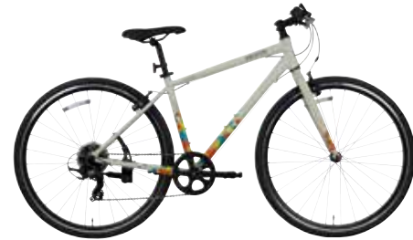
マットシンボルベージュ