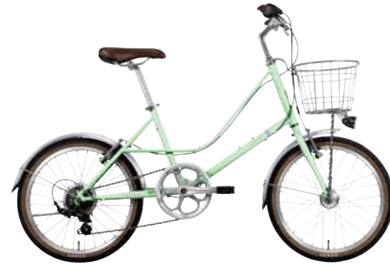
マットライトグリーン