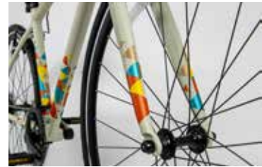
マットシンボルベージュのデザイン