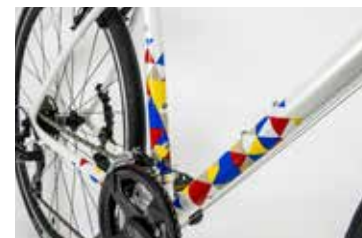
シンボルホワイトのデザイン