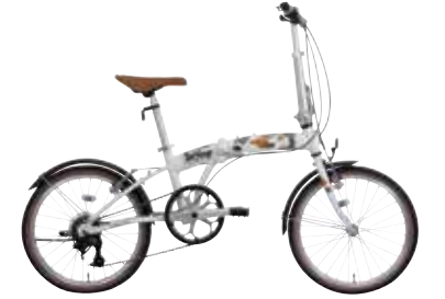
マットミケホホワイト