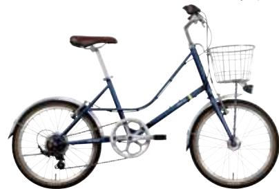
マットダークブルー