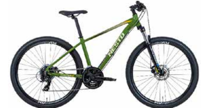
マットカーキグリーン