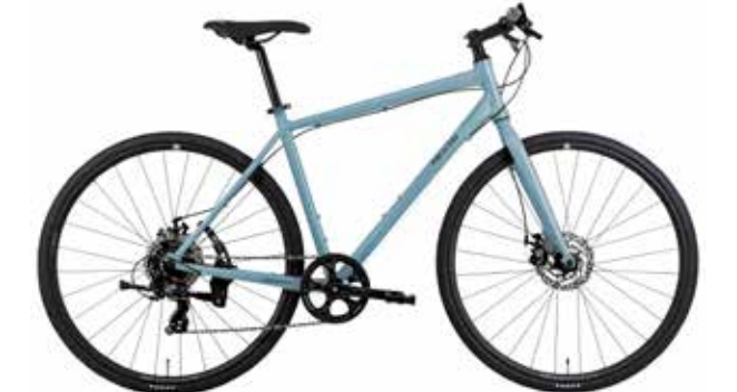
マットソリッドグレー