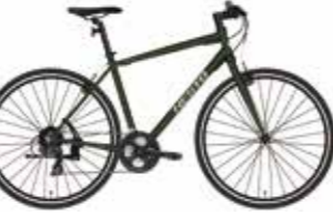
マットダークグリーン