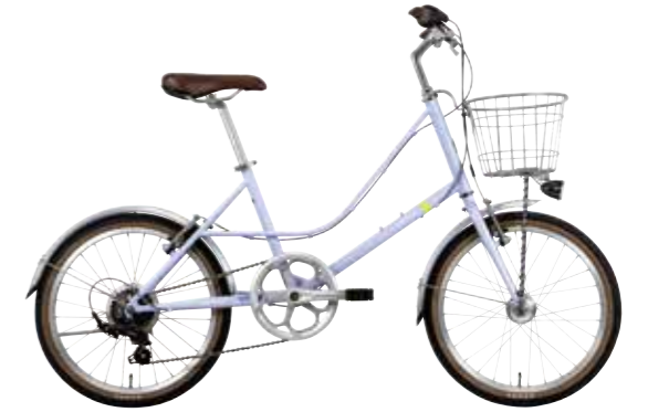
マットライトパープル