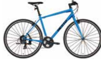
マットベイスサイドブルー