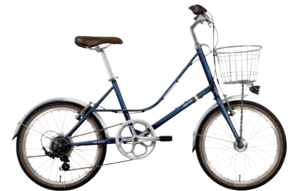
マットダークブルー