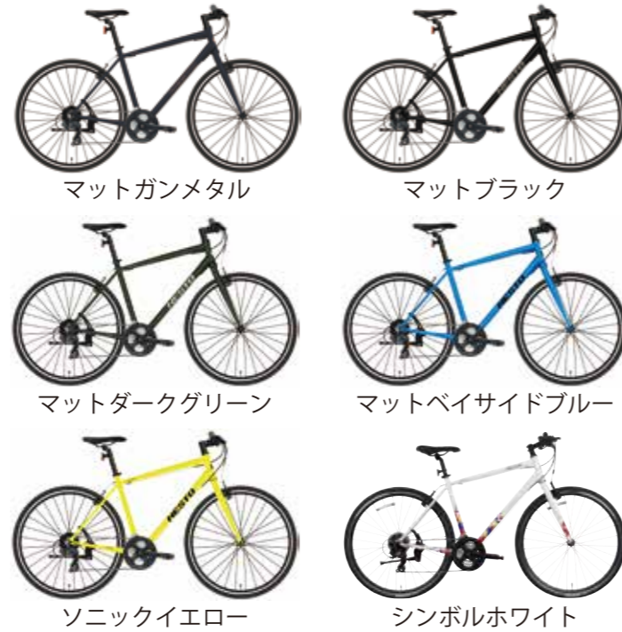
マットガンメタル