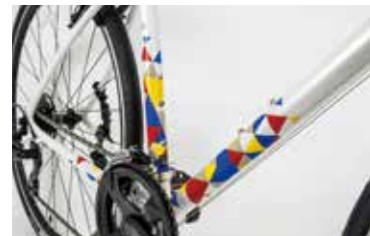
シンボルホワイトのデザイン