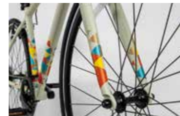
マットシンボルベージュのデザイン