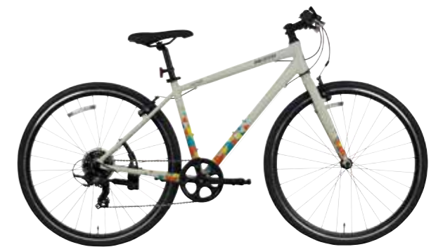
マットシンボルベージュ