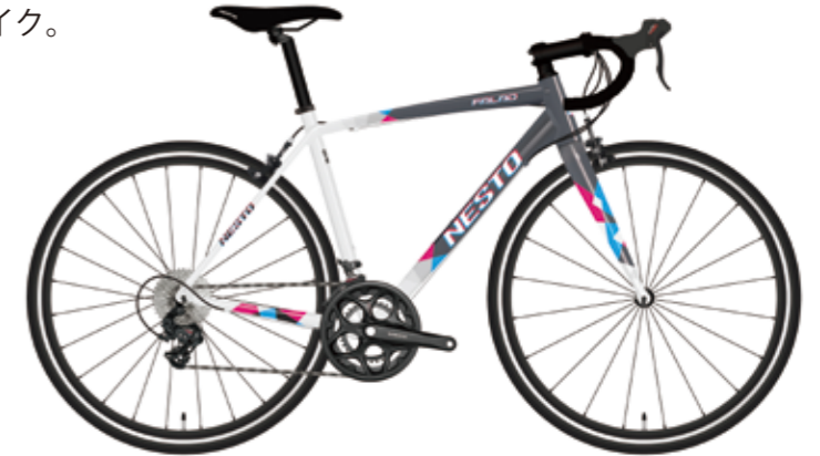
スモークグレー / アッシュホワイト