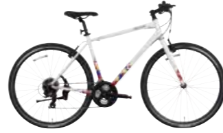
シンボルホワイト