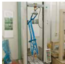
フレーム・フォークのエネルギー吸収試験やスポークの破断試験を実施