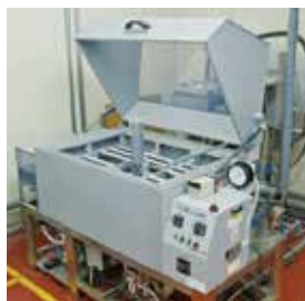
金属表面処理（クロームめっきなど）を塩水（キャス溶液）噴霧試験し、耐食性を評価