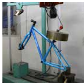
フレームに衝撃を与えることで耐久性を評価