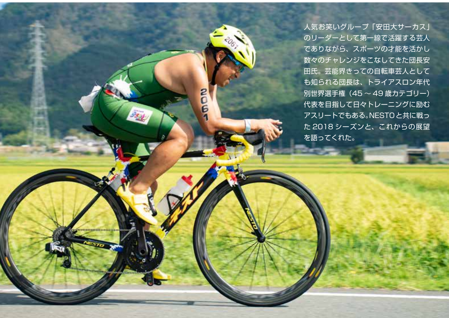
第4回京都丹波トライアスロン in 南丹 バイクパート

人気お笑いグループ「安田大サーカス」のリーダーとして第一線で活躍する芸人でありながら、スポーツの才能を活かし数々のチャレンジをこなしてきた団長安田氏。芸能界きっての自転車芸人としても知られる団長は、トライアスロン年代別世界選手権（45～49歳カテゴリー）代表を目指して日々トレーニングに励むアスリートでもある。NESTOと共に戦った2018シーズンと、これからの展望を語ってくれた。