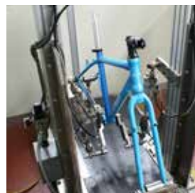
ペダリングを想定した荷重をフレームに加え耐久性を評価