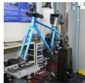
フレーム・フォーク・ハンドル等の耐振性を評価