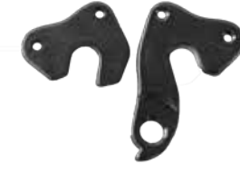
発注コード：445117 価格：オープン価格 対応車種：TRAIZE PRO-K (135x9mm)