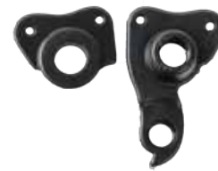
発注コード：445118 価格：オープン価格 対応車種：TRAIZE PRO-K (142x12mm)