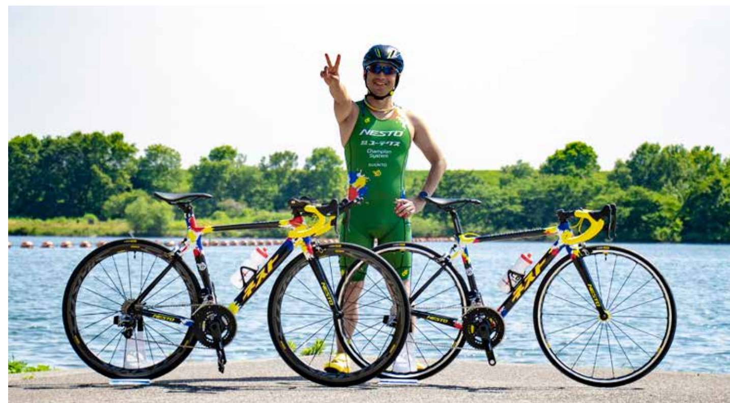
2019シーズンもレースに合わせて2台のロードバイクを使い分ける

バイク供給やメンテサポート、その他トレーニング環境など最高のものを用意してもらっているのでは自分が結果を出すだけです。2018シーズンは怪我の影響で長期間休んでしまったので、2019シーズンに向けて常に調子上げ続けるイメージでやっていきたいですね。ランニングにまだ不安がありますが、トライアスロンは幸か不幸か3種目あるので、できる種目から強化していくことができます。レース活動を本気で応援してくれている人たちのために、過去最高の結果を勝ち取りたいと思います。