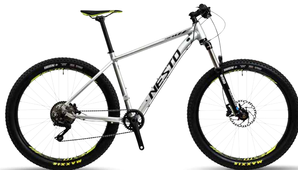
サンドプラストアルマイトシルバー